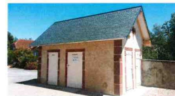
Réfection complète de la toiture du bâtiment des toilettes publiques réalisée par la SARL RUFFAUT Frères de SORBIER