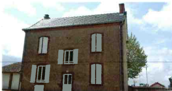
Réfection complète de la toiture du logement communal « E » réalisée par la SARL RUFFAUT Frères de SORBIER