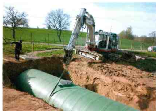
Remplacement de la fosse toutes eaux de la station d'épuration réalisé par l'entreprise GUERET TP de SORBIER