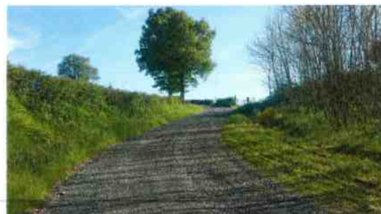
Réfection du chemin des Fréchets réalisée par l'agent communal et l'entreprise JACQUET de THIONNE