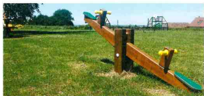
Installation de 2 nouveaux équipements à l'aire de jeux financés par la Communauté de Communes